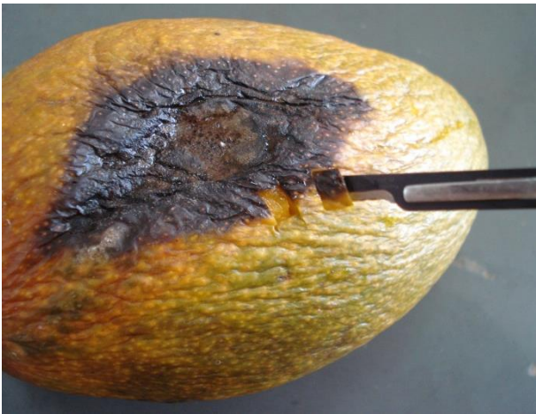
Figura 2. Fruto de manga com sintomas de antracnose.