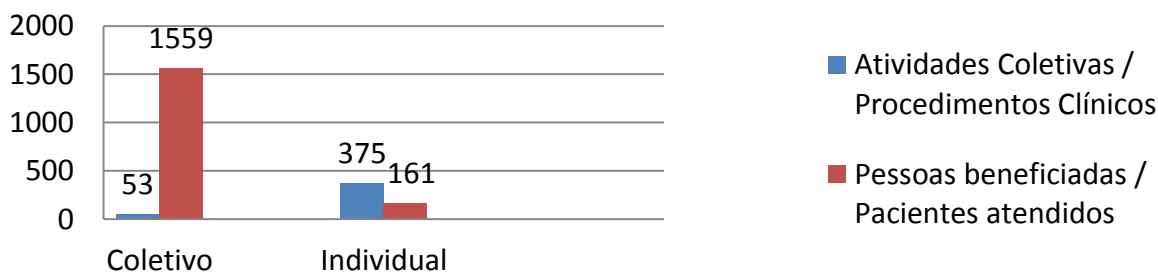
Gráfico 3: Distribuição de 53 Atividades coletivas e 1559 Procedimentos individuais odontológicos realizados na ESF Tiradentes, no período de fevereiro a junho de 2016, durante o Estágio Supervisionado do 10 o período do Curso de Odontologia da Funorte.