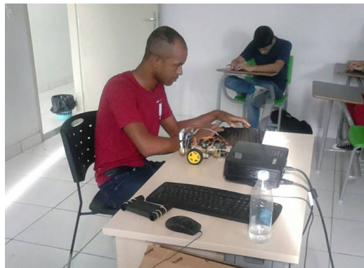
Figura 1. Robô Completo Com indicação dos Componentes Figura 2. Apresentação no Arduino Day