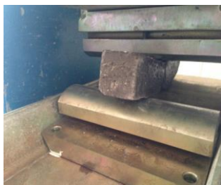
Figura 1- Ensaio RFTA