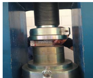
Figura 2- Ensaio RCTA